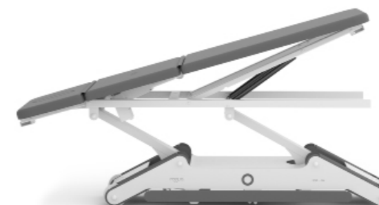
Posición Trendelenburg (solo versión 2 motores)