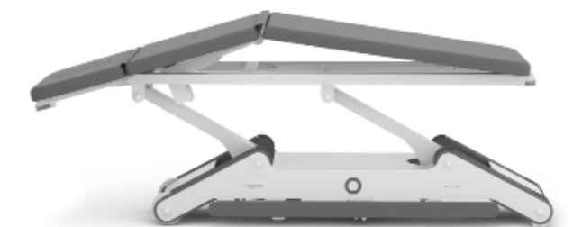
Posición cifosis (solo versión 2 motores)