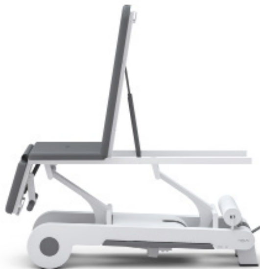
Posición silla de tratamiento