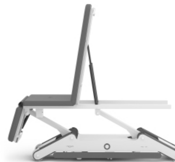
Posición silla de tratamiento